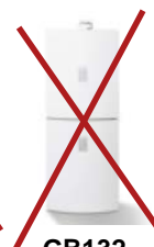
GB132 GB132 T