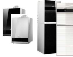
GB182i GB192i GB192iT