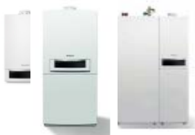
GB172 GB172T GB172T50, T210SR GBH172