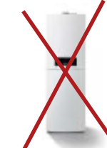
GB152 GB152 T